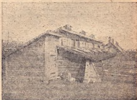
Научно-исследовательский институт (Минск). Американо-исследовательский свинарник № 2 для северных районов

При устройстве же уборной в коридоре в последнем при кормлении свиней будет постоянная грязь и сырость, но зато это дает некоторую экономию площади. Однако в свинарниках при наличии общей столовой и общей уборной в минимуме будет не площадь, а кубатура на голову. Это обстоятельство также говорит за то, что во всех отношениях выгоднее устраивать общую