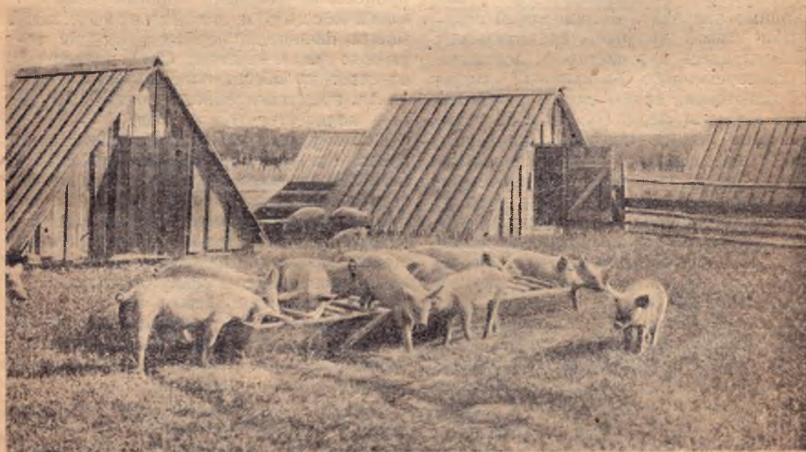
Племхоз Никоновского треста Свиновод. Хряки 5-месячного возраста в Канадском городке