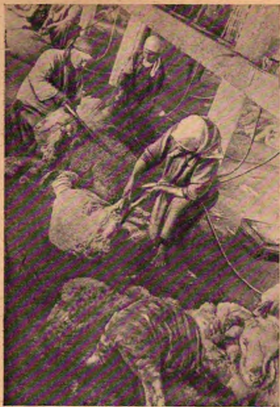
Механизированная стрижка овец в Марьяновском овцевыводческом хозяйстве (Западная Сибирь)