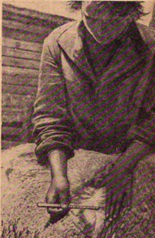
Измерение шерсти перед стрижкой в Марьяновском

здается ненормальная обстановка. Сакманам негде повернуться, матки пасутся по выбитому пастбищу и, как естественное следствие, увеличивается отход ягнят. Осенью, при проведении искусственного осеменения, повторится та же толчея маток на одном выбитом участке, и овцы пойдут в зиму плохо упитанными.