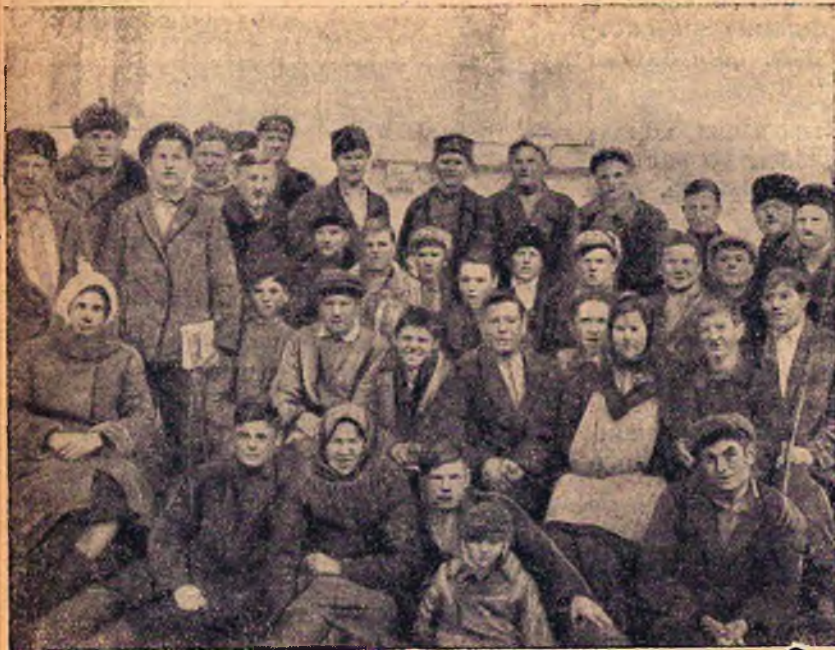
Общий снимок курсантов, бригадиров по овцеводству (Крымский опорный пункт)