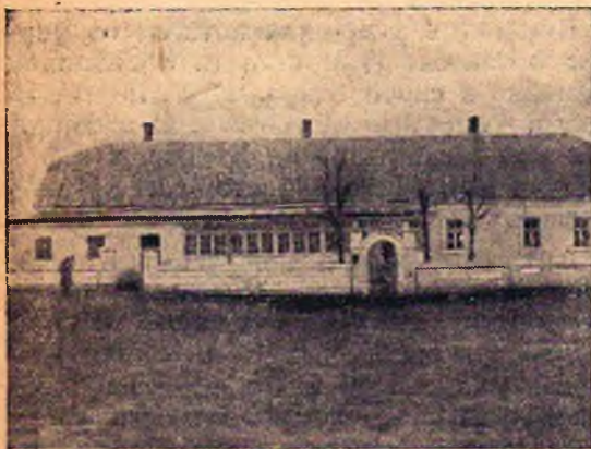
Здание Крымского опорного пункта научно-исследовательской работы по овцеводству при совхозе «Мсиай»