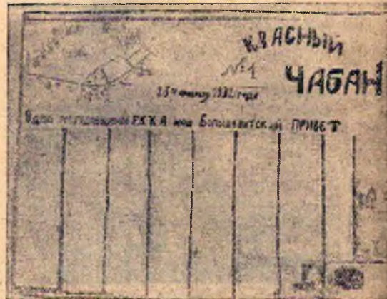
Стенгазета № 1 курсов бригадиров по овцеводству (Крымский опорный пункт)

ничества по окоту, стрижке и уходу. В целях полного овладения техникой овцеводства общее собрание курсантов