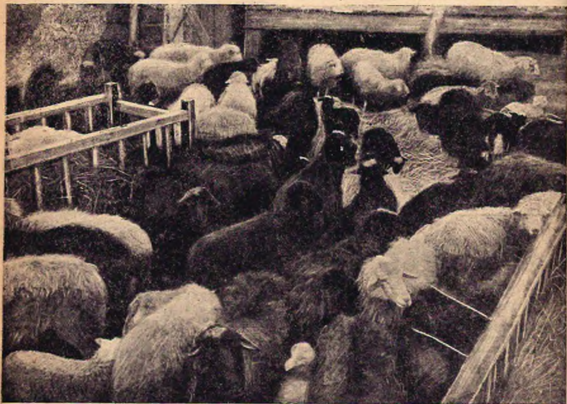
Внутренний вид овчарни кастеринского колхоза во время окота (Старооскол. ЦЧО).