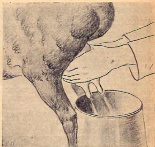
рис. 5. Второй прием

Третий прием дойки: повторяется дойка сосков. Во время дойки дояр одной рукой держит овцу, а другой поочередно сжимает и вытягивает пальцами сосок; сделав это 2—3 раза, он переходит к сдаиванию таким же образом другого соска (рис. 6). Если он замечает, что в вымени остается еще молоко, дойка повторяется. При массовой дойке пальцы дояра обычно загрязняются и их необходимо вытирать о влажную половину полотенца. Дояры следят, чтобы выдоенные овцы не имели бы влажного вымени, так как оно легко обветривается и на нем получают трещины. В процессе дойки молоко из подойника процеживается во фляги через металлическую педилку с двойным решетом и ватным фильтром (рис. 8).