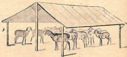
Рис. 7. Навес для отбитых от маток ягнят

При плохих выпасах отбитых от овец ягнят необходимо подкармливать. Для этого вблизи навеса устраиваются для них кормушки. Обычным кормом является сыворотка, смешанная