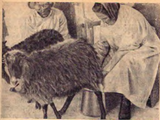
рис. 2. Дойна овец

должны мыть руки мылом, одевать прозодежду и только после этого приступать к дойке. Для помощи во время дойки дояры должны садиться так, чтобы опытные находились рядом с неопытными.