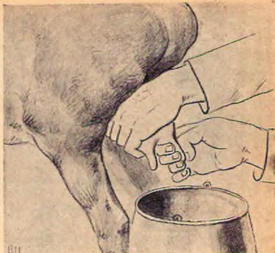
рис. 4. Первый прием дойки

Второй прием дойки: дояр обхватывает обеими руками вымя по всей поверхности и, слегка сжимая его, сдаивает молоко в подойник (рис. 5).