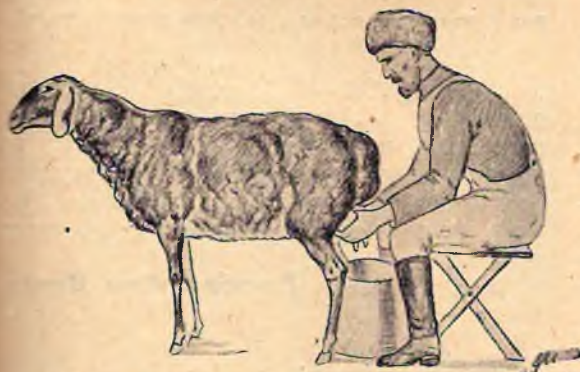
рис. 3. Общий вид дояра во время доения овец

У овец обязательно выдаивают все молоко и если какая-либо овца сорвется со станка, ее обязательно возвращают на станок и додаивают (предупреждение мастита). Во время дойки дояры учитывают естественные потребности овец и при характерном вытягивании спины удаляют свой подойник, чтобы не загрязнить молоко. Дояры должны коротко стричь свои ногти, чтобы не поцарапать сосков или вымени овец. При дойке необходимо всегда иметь при себе чистое полотенце, одна половина которого мокрая, другая сухая для обтирания вымени овец (рис. 2 и 3).