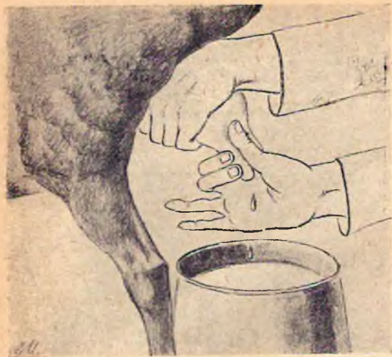
Рис. 6. Третий прием

После окончания дойки флаги с молоком отправляются немедленно на завод. Расстояние от места удоя до завода не должно превышать 7 километров, при хороших перевозочных средствах и дороге, путь следования может быть до 10 километров.